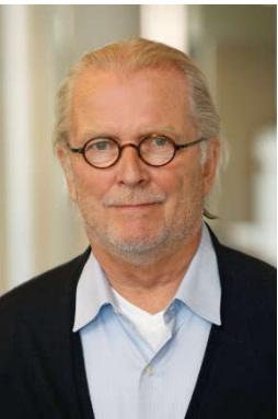
J.Ph.Th. Verdonck Huffnagel

Mevrouw Stout ervaart het altijd als een feest om deelgenoot te mogen zijn van zo'n belangrijke dag met een gouden randje. Een paar in de echt te mogen verenigen is heel bijzonder. Het voorgesprek houdt mevrouw Stout thuis bij het aanstaand bruidspaar. Ze neemt uitvoerig de tijd om de wensen en achtergrond van het paar grondig door te nemen. Tijdens de plechtigheid benadrukt mevrouw Stout "geniet van elkaar, respecteer elkaar en geef elkaar de ruimte".